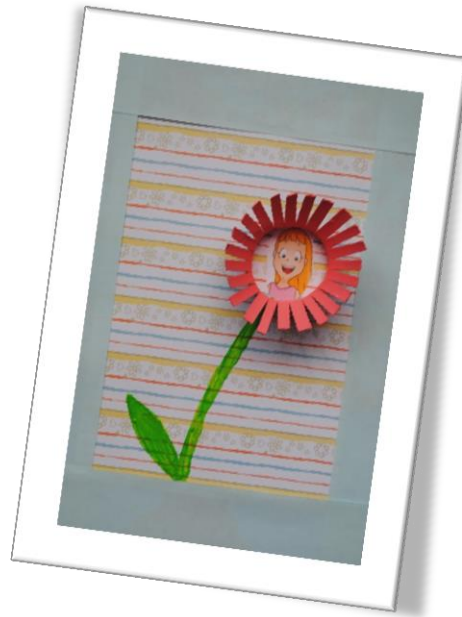
Foto in bloem